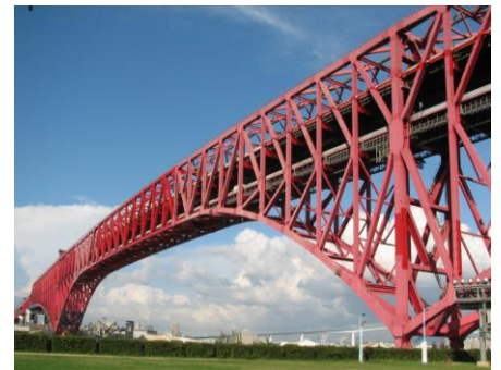
田中賞を受賞した港大橋