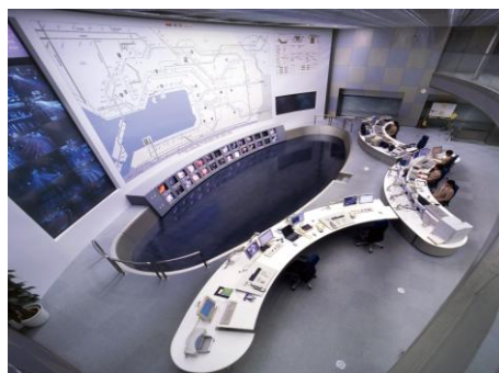
24時間稼働する交通管制センター