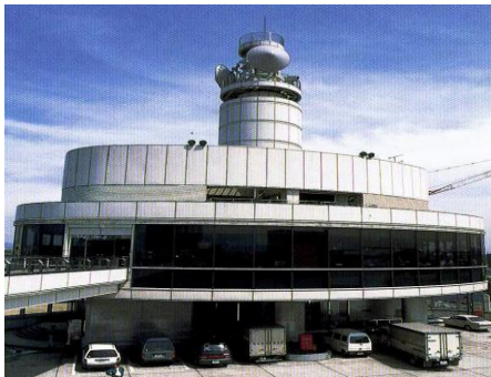
改装された朝潮橋PA

※強風時は橋の下の公園からの見学になります。また、内容は都合により変更する場合があります。